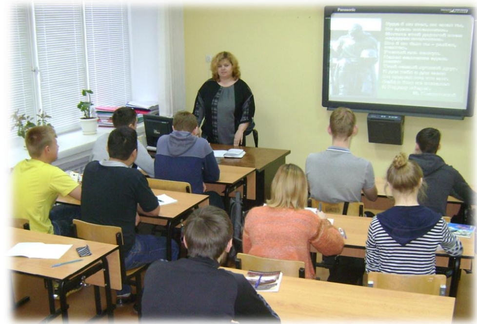
Урок мужества ко Дню неизвестного солдата