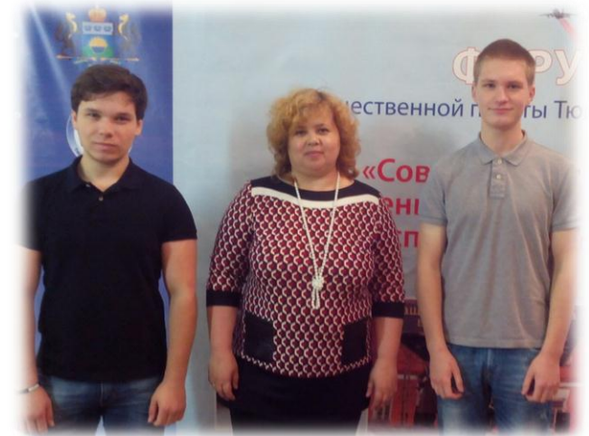
Форум Общественной палаты Тюменской области «Современная модель военно-патриотического воспитания молодежи», 2015