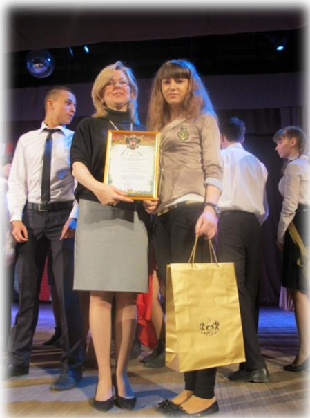
Областной конкурс электронных Книг памяти проекта «Отечества достойные сыны», Диплом III степени, 2013

Включение обучающихся в научно-исследовательскую деятельность, участие в научно-практических конференциях