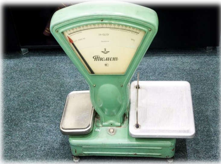
Настольные весы, которые выпускал Тюменский весовой завод

Среди экспонатов - оборудование, использовавшееся в торговле в середине 20 века