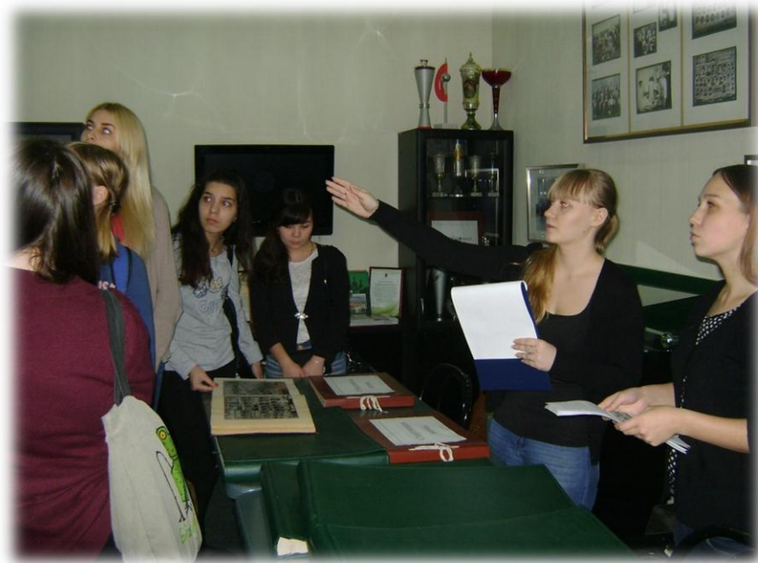
«День первокурсника в музее»

Проведение экскурсий, классных часов, уроков мужества, дискуссий