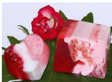
Мыловарение Стоимость: 500,00 рублей Продолжительность: 4 часа