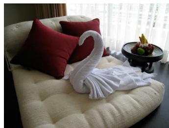
Необычное в обычном Стоимость: 300,00 рублей Продолжительность: 1,5 часа