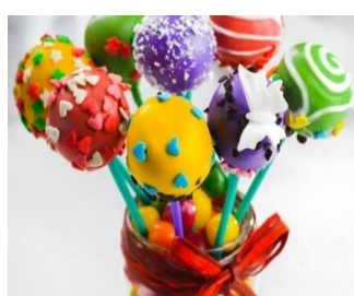
Кейк - попсы Стоимость: 400,00 рублей Продолжительность: 2 часа