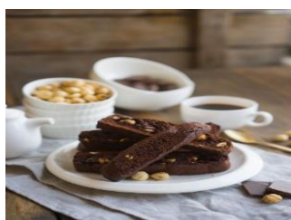
Шоколадные бискотти Стоимость: 500,00 руб. Продолжительность: 3 часа