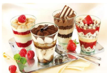
Десерты в веринах Стоимость: 400,00 рублей Продолжительность: 2 часа