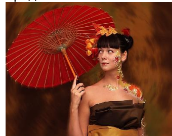
Основы «Боди арта» Стоимость: 500,00 руб. Продолжительность: 3 часа