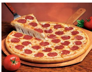
Пицца Пепперони Стоимость: 400,00 рублей Продолжительность: 2 часа