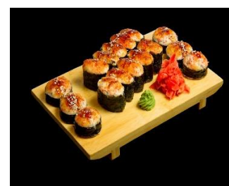
Горячие роллы Стоимость: 500,00 рублей Продолжительность: 4 часа

Стоимость и продолжительность мастер-классов могут быть изменены, при наборе групп менее 10-ти человек.