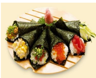
Темаки - суши Стоимость: 500,00 рублей Продолжительность: 4 часа