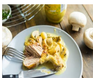
Курица в горчичном соусе с грибами Стоимость: 500,00 рублей Продолжительность: 3 часа