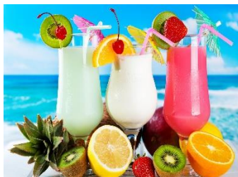
Безалкогольные коктейли Стоимость: 400,00 рублей Продолжительность: 2 часа