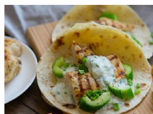
Курица с соусом цацки Стоимость: 400,00 рублей Продолжительность: 3 часа