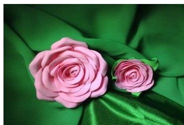
Цветы из фиамирана Стоимость: 500,00 рублей Продолжительность: 2 часа

Многофункциональный центр прикладных квалификаций приглашает Вас получить незабываемые впечатления от участия в МАСТЕР- КЛАССАХ: