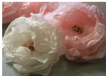
Цветы из ткани Стоимость: 500,00 рублей Продолжительность: 2 часа