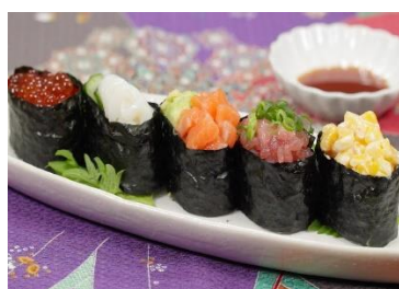
Гункан - суши Стоимость: 500,00 рублей Продолжительность: 4 часа