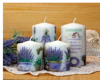
Изготовление декоративных изделий в технике декупаж Стоимость: 500,00 рублей Продолжительность: 2 часа