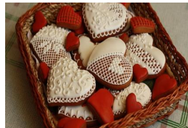
Роспись медовых пряников Стоимость: 400,00 руб. Продолжительность: 2 часа

Стоимость и продолжительность мастер-классов могут быть изменены, при наборе групп менее 10-ти человек.