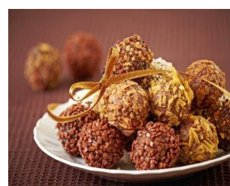
Конфеты «Трюфель» Стоимость: 400,00 руб. Продолжительность: 2 часа