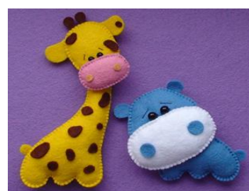
Изготовление брошей, аксессуаров и игрушек из фетра Стоимость: 500,00 руб. Продолжительность: 2 часа