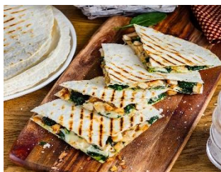
Кесадилья Стоимость: 400,00 рублей Продолжительность: 2 часа

Многофункциональный центр прикладных квалификаций приглашает Вас получить незабываемые впечатления от участия в МАСТЕР- КЛАССАХ: