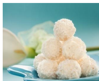
Конфеты «Рафаэлло» Стоимость: 400,00 рублей Продолжительность: 2 часа