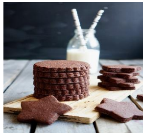
Шоколадное печенье Стоимость: 400,00 рублей Продолжительность: 2 часа