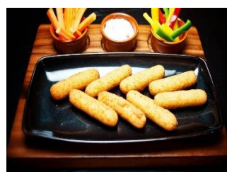
Сырные палочки Стоимость: 400,00 рублей Продолжительность: 2 часа