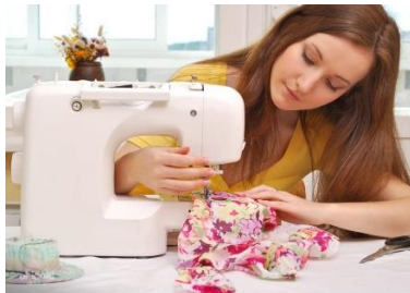
Техника бесшовного края Стоимость: 500,00 рублей Продолжительность: 2 часа