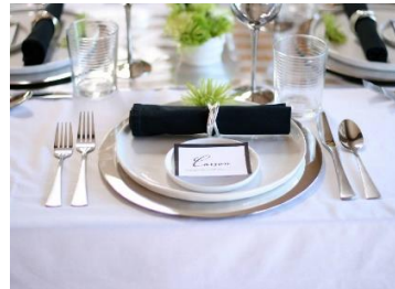
Основы сервировки стола Стоимость: 400,00 рублей Продолжительность: 1,5 часа

Стоимость и продолжительность мастер-классов могут быть изменены, при наборе групп менее 10-ти человек.