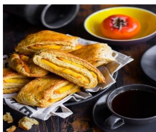
Ржаные сконы Стоимость: 400,00 рублей Продолжительность: 2 часа