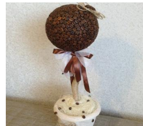
Изготовление «Дерева счастья» Топиария Стоимость: 800,00 руб. Продолжительность: 3 часа