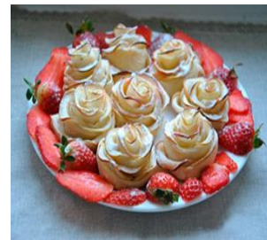
Слойки «Яблочные розы» Стоимость: 400,00 руб. Продолжительность: 2 часа