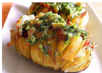
Запеченная картошечка с сыром Стоимость: 400,00 рублей Продолжительность: 3 часа