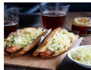
Хот дог Стоимость: 400,00 руб. Продолжительность: 2 часа