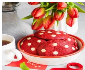
Печенье «Красный бархат» с белым шоколадом Стоимость: 500,00 рублей Продолжительность: 2 часа

Многофункциональный центр прикладных квалификаций приглашает Вас получить незабываемые впечатления от участия в МАСТЕР- КЛАССАХ: