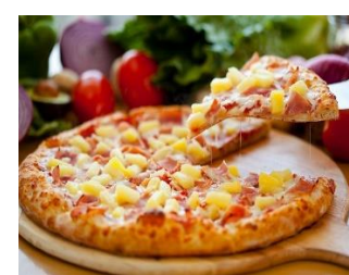
Пицца Гавайская Стоимость: 400,00 руб. Продолжительность: 2 часа