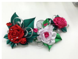
Украшения из лент Стоимость: 500,00 рублей Продолжительность: 2 часа