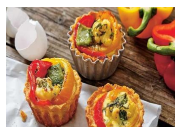
Закусочные маффины Стоимость: 500,00 руб. Продолжительность: 2 часа