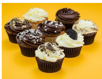
Шоколадные маффины Стоимость: 400,00 рублей Продолжительность: 2 часа