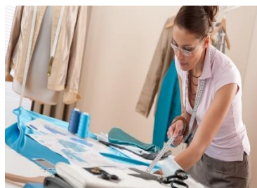
Кройка и шитье Стоимость: 1000,00 рублей Продолжительность: 20 часов