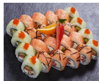
Роллы Стоимость: 500,00 рублей Продолжительность: 4 часа