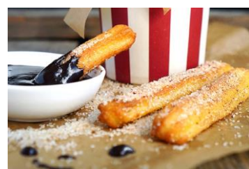
Чуррос - испанский десерт Стоимость: 400,00 рублей Продолжительность: 2 часа