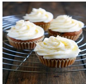
Морковные капкейки Стоимость: 400,00 рублей Продолжительность: 2 часа