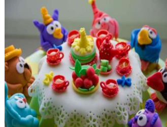
Декоративные элементы для торта из мастики Стоимость: 400,00 рублей Продолжительность: 2 часа