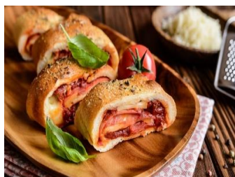
Пицца Стромболи Стоимость: 400,00 руб. Продолжительность: 3 часа