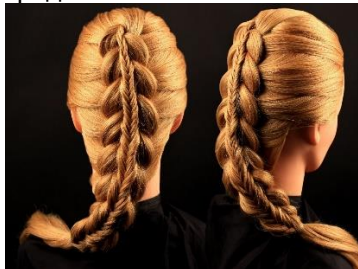
Плетение косичек в разных техниках Стоимость: 300,00 рублей Продолжительность: 3 часа