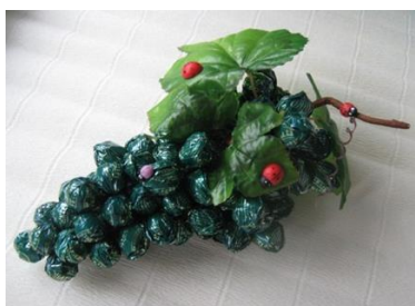
Композиция из конфет Стоимость: 500,00 рублей Продолжительность: 3 часа