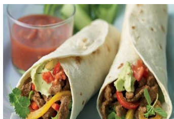
Буррито Стоимость: 400,00 рублей Продолжительность: 2 часа